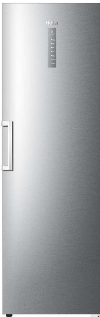
Haier SAP Code: B30J20E0K